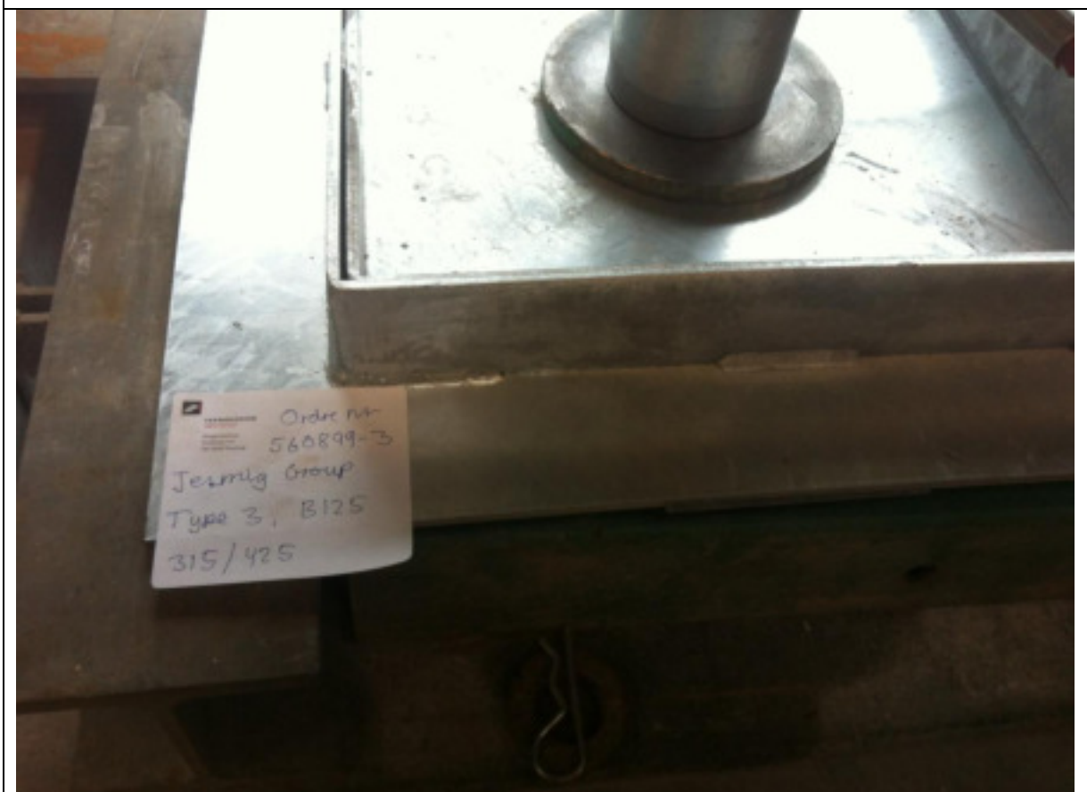
Jesmig Group ApS dæksel, B125, dimension 367x367 mm