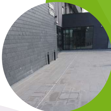
Brønddæksler Egedal Rådhus

Jesmig Brønddæksler og Riste produceres af smedejern og gennemgår herefter en korrosionsbehandling med galvanisering, hvorved de bliver rustfri. Nogle af dækslerne laves også i Corten stål. Dækslerne er godkendt af Teknologisk Institut i henhold til DS/EN 124. Produkterne er dansk designet og dansk produceret.