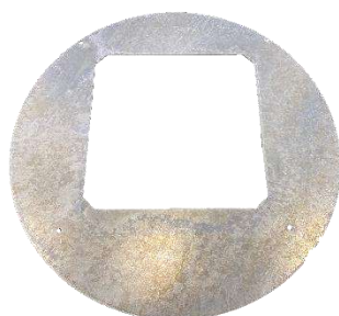
Dækplade Ø700 & Ø940